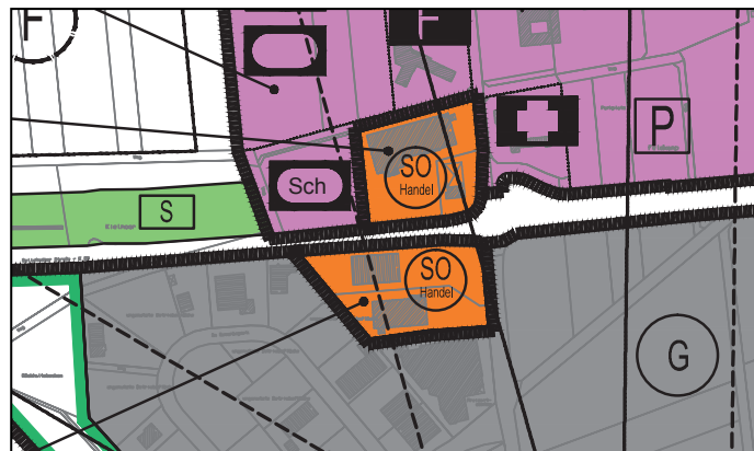
Auszchnitt aus dem wirksamen FNP Stand 2014

Mit der 1. Änderung des B-Planes war im Jahr 2002 auch die 41. Änderung des Flächennutzungsplanes (FNP) als Parallelverfahren durchgeführt worden. Mit dieser 41. FNP-Änderung wurde der bis dahin im wirksamen FNP als „Gewerbliche Baufläche“ dargestellte Bereich in ein Sondergebiet für den großflächigen Einzelhandel umgewandelt. Damit stellt der wirksame FNP derzeit keine ausreichende planungsrechtliche Grundlage für die geplante 3. Änderung des B-Planes im Bereich des ALDI-Grundstückes (Flurstück Nr. 226/2) dar und mit der B-Plan-Änderung muss nunmehr auch der FNP erneut geändert werden. Zu diesem Zweck wird die 64. FNP-Änderung als Parallelverfahren gem. § 8 (3) BauGB durchgeführt.