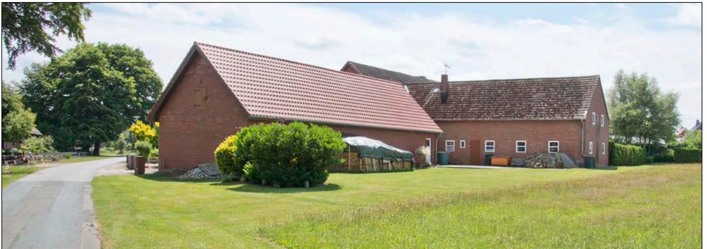
Hofanlage Zum Holz - östlich des Plangebietes