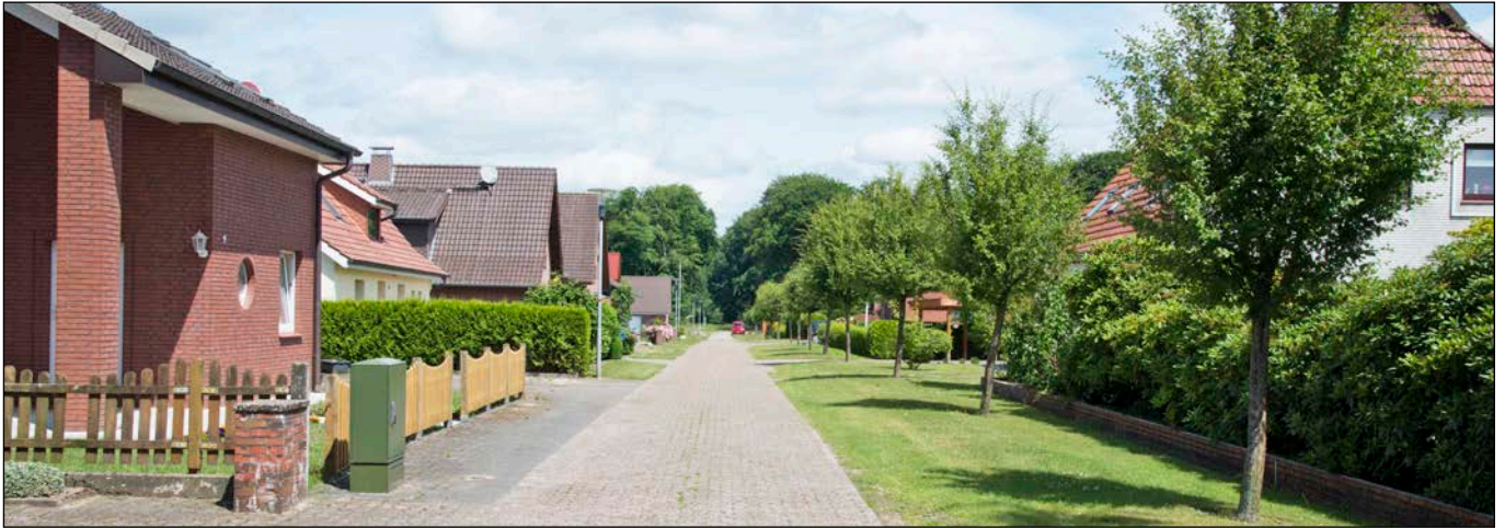
Papenkamp - Blick in nördliche Richtung

- Fotografische Bestandsaufnahme am 27.06.2017 -