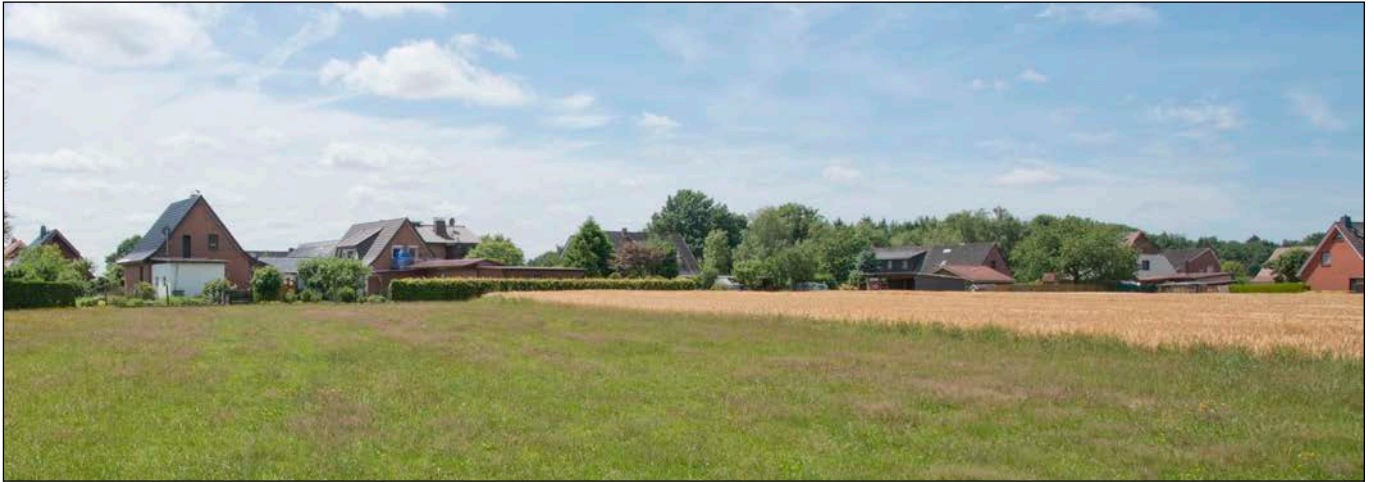
Blick in südliche Richtung über das Plangebiet hinweg auf die Wohnbebauung an der Ringstraße

- Fotografische Bestandsaufnahme am 27.06.2017 -