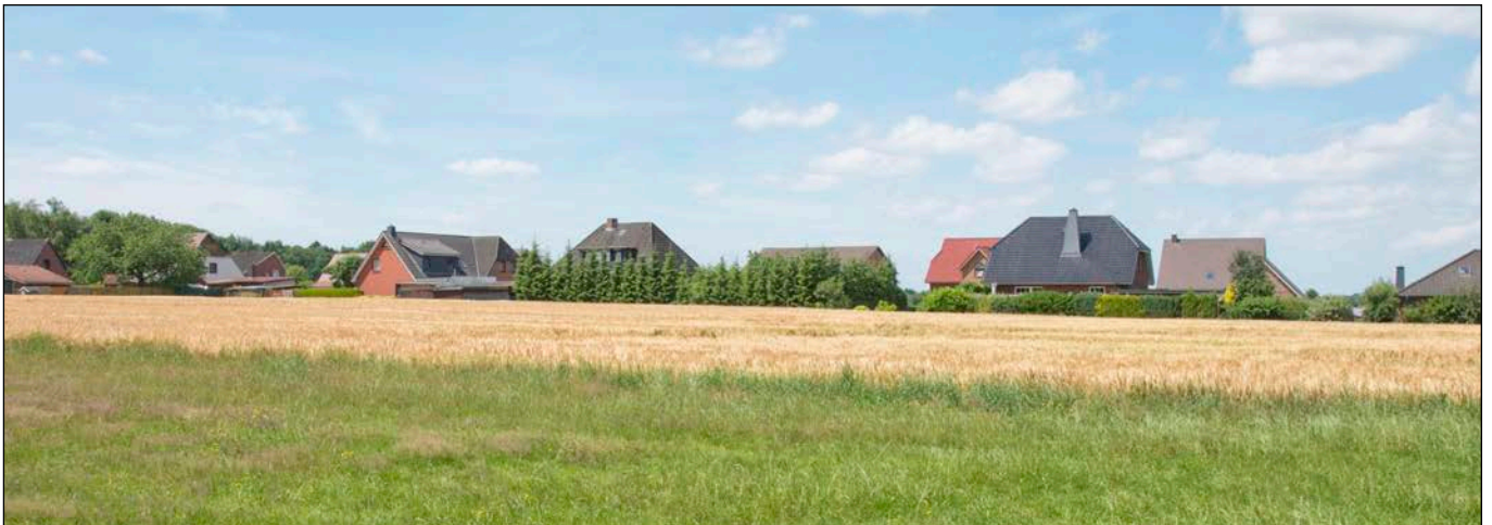
Blick in westliche Richtung über das Plangebiet hinweg auf die Wohnbebauung am Papenkamp